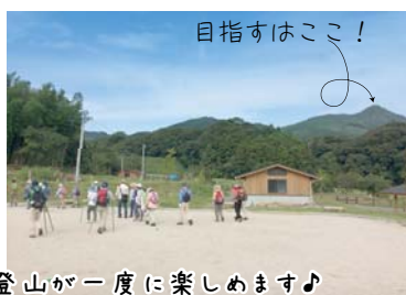
飯盛神社等の名所巡りと登山が一度に楽しめます♪